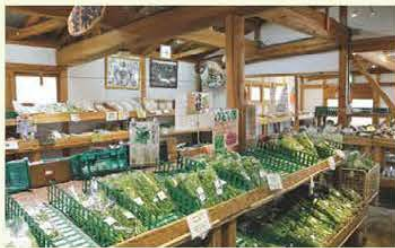
新鮮な野菜が豊富に揃う