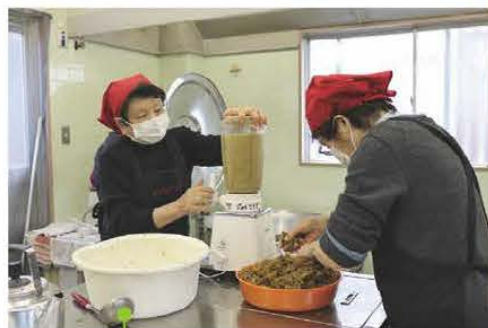
一つ一つ声かけあって 丁寧に作業する

作り方は至ってシンプル。ウメの種を一つ一つ取り除いて、ミキサーでペースト状に練り込む。この時に「カチツ」と音がすると、種が残っているので何度も種がないか確認している。ウメがペースト状になると大鍋で2時間かけて炊きあげていく。