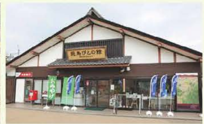
道の駅飛鳥「飛鳥びとの館」