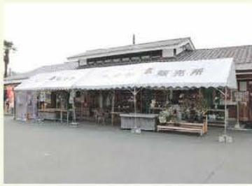
農産物直売所「あすか夢販売所」

直売所ではそれぞれの商品を見やすく買ってもらえるよう工夫がなされていて、イチゴ（あすかルビー）、シャインマスカット、トマトなど季節ごと旬のものも多く販売されているので、県内外から多くのお客さんが訪れる。さらには、超小型モビリティレンタルサービス「MICHI-MO（ミチモ）」がある。自動車よりコンパクトで小回りが利き、環境性に優れた、最大2人乗りの電気自動車に乗って、明日香村の史跡などを巡ってみてはどうですか？