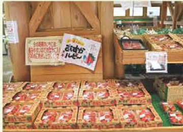
明日香村特産品「あすかルビー」