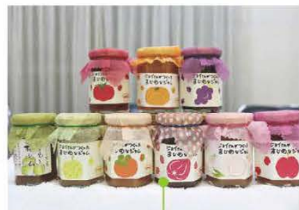
豊富なジョイクラブのジャム

ジャムの一つである「夢見る梅ジャム」は、同市内の酒造会社が梅酒製造後に残る実の処理に困っていることを聞き、ジャムづくりを思いついたという。