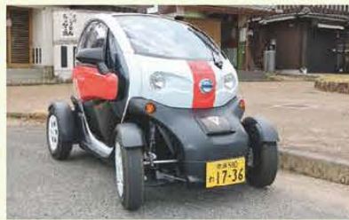
超小型モビリティレンタル「MICHI-MO」