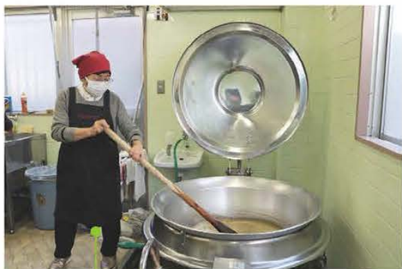
2時間かき混ぜ続けると 梅の香りが漂う

煮詰めたジャムを熱いうちに瓶に詰め、蓋をして、蒸し器で20分間蒸しあげる。蒸しあげたあと、すぐに水で冷やす。急冷することによって色合いが良くなる。最後にラベルを貼り、かぶせ紙を瓶の蓋にかぶせて紐で留めると完成。