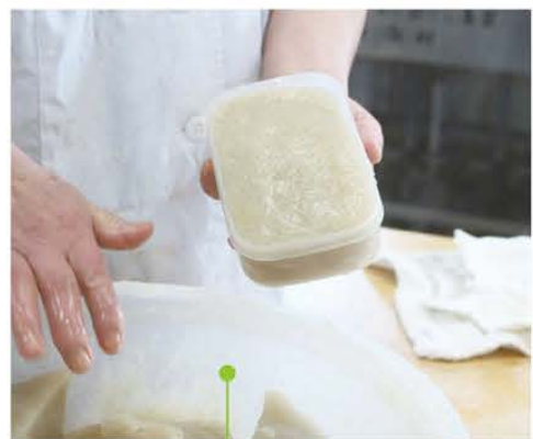
キレイに成型されたコンニャク

成型したコンニャクは約40分間茹でて、水にさらして粗熱を取る。よく水切りした後、袋に入れる。真空パック機で空気を抜き真空状態にする。パックされたコンニャクは、さらに1時間熱処理を行い、最後にシールなどを貼って完成する。