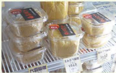
全国で2カ所で作られていない「えんどう味噌」

葛城市は奈良県の中西部に位置し、古来より豊かな自然と歴史があり、文化の香りが漂い数多くの国宝や重要文化財がある。さらに我が国、最古の官道である竹内街道など名所・旧跡も多く、訪れる人々を魅了し続けている。1995年、国道165号線に道の駅「ふたかみパーク當麻」がオープン。駅内には地元で収穫された新鮮な野菜や生花など多数の商品が販売されている。また、隣接するレストラン「當麻の家」ではメニューが15種類と豊富にある。 一番の人気商品は、毎日焼いている「玄米食パン」。もちりとして、焼くと香ばしい風味が増すという。また、全国的にも珍しい「えんどう味噌」は、同駅で栽培されたエンドウ豆を使用しており、独特の風味や甘みを楽しむことができる。 さらに、昨年3月からは白イチゴ「パールホワイト」を使用した「白いちごソフト」が販売されている。同駅では多くの方に訪れてもらえるようにサツマイモ掘りなどの農場体験なども実施する。