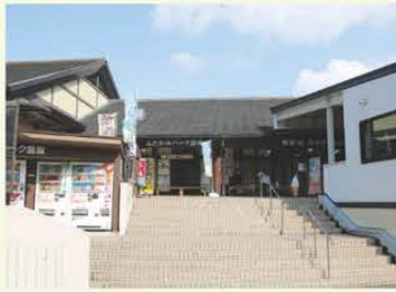
道の駅「ふたかみパーク當麻」