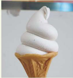
パールホワイトたっぷり「白いちごソフト」

葛城市は奈良県の中西部に位置し、古来より豊かな自然と歴史があり、文化の香りが漂い数多くの国宝や重要文化財がある。さらに我が国、最古の官道である竹内街道など名所・旧跡も多く、訪れる人々を魅了し続けている。1995年、国道165号線に道の駅「ふたかみパーク當麻」がオープン。駅内には地元で収穫された新鮮な野菜や生花など多数の商品が販売されている。また、隣接するレストラン「當麻の家」ではメニューが15種類と豊富にある。 一番の人気商品は、毎日焼いている「玄米食パン」。もちりとして、焼くと香ばしい風味が増すという。また、全国的にも珍しい「えんどう味噌」は、同駅で栽培されたエンドウ豆を使用しており、独特の風味や甘みを楽しむことができる。 さらに、昨年3月からは白イチゴ「パールホワイト」を使用した「白いちごソフト」が販売されている。同駅では多くの方に訪れてもらえるようにサツマイモ掘りなどの農場体験なども実施する。