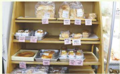
「玄米食パン」のほか「あん食パン」などたくさんの種類がある