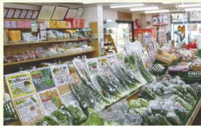
新鮮な野菜やオリジナル商品がいっぱいの駅内