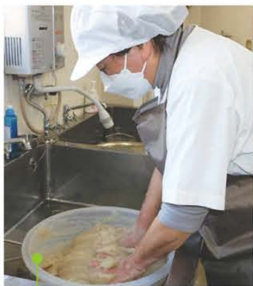
さらにおいしくなるようひと手間かけて

この時にコンニャクの柔らかさを手で確認し、適度な柔らかさになるよう微調整を行う。適度な柔らかさになれば炭酸ナトリウムを加えてもう一度、練り上げ、ひとつずつ型に入れて成型する。この時には空気が入らないよう気をつけながら成型する。