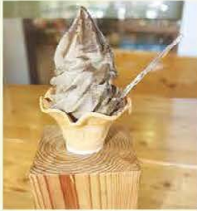
番茶の粉末たっぷり「番茶ソフトクリーム」