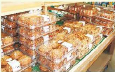
月1度開催されるコストコフェア