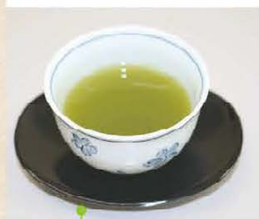
緑がキレイな グリーンウェーブのお茶

これらの加工品の販売先は、地元「月ヶ瀬温泉ふれあい市場」、「湖畔の里つきがせ」はもちろんだ、ならけんの農産物直売所「まほろばキッチン榎原店」、「JR奈良駅前店」などで販売されている。