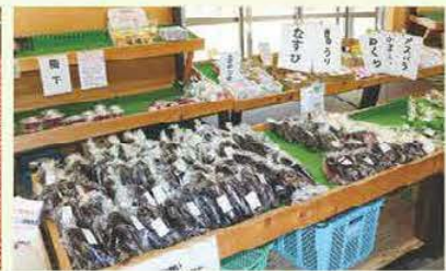
隣接する野菜直売所では旬の野菜がたくさん販売されている