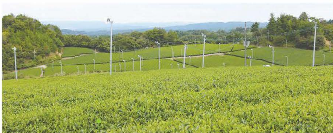
一面に広がるグリーンウェーブのお茶畑

今後について、「時代の流れで急須に入れてお茶を飲む機会が少なくなってきた。月ヶ瀬のおいしいお茶を一度、急須に入れて飲んでみて欲しい。そして、これからも丹精込めて作った高品質なお茶をたくさんの方に日常的に飲んでもらえるよう頑張っていきたい」と意気込む。