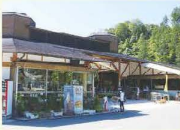
道の駅 吉野路大淀iセンター

道の駅では珍しいコストコフェアが毎月第4金曜日に開催され、多くのお客さんで賑わっている。また、アクセサリー作りや皮小物製品作りなどのワークショップも開催されるなど、多くの方が訪れています。