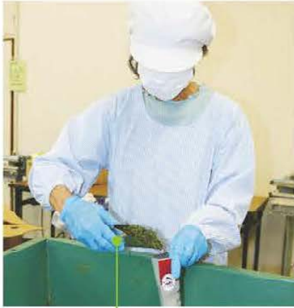
一つずつ袋に詰めていく

同組合での総栽培面積は63ヘクタール、総生産量は生葉が150万錠、乾茶は37万錠、そのうち年間1630錠の乾茶を使用してお茶の加工品を販売している。メンバー同士でアイデアを出し、話し合いを重ねることにより、20種類もの加工品を作り出した。