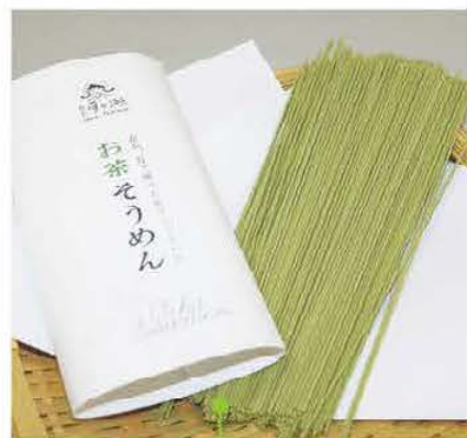
人気商品の一つ 「お茶そうめん」

最近、定番商品になってきている「お茶そうめん」(200g 400円税込み)がある。同組合で栽培した緑茶の粉末をふんだんに使用したそうめんで、開封するといとお茶の香りが漂う。「夏は冷たいそうめんが涼しく、これからの季節はにゅうめんにして食べていただき、暖かく過ごしてほしい」と相和さん。さらにアレンジメニューで冷製パスタもおすすめで人気があり、販売所に並べるとすぐに売り切れるという。