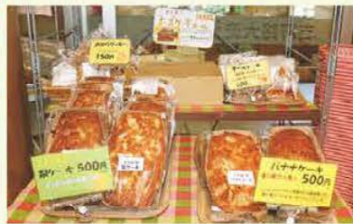
人気商品の一つである焼きたてパン